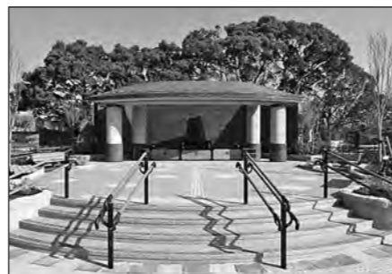
緑が丘霊園の合葬型墓所

▶今回の質問で、今後の霊園整備では、墓参時の休憩施設の設置や法事等が出来る施設等の拡充についても提案しました。市は、提案に対し今後積極的に検討したいと回答しました。