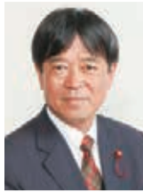
川崎市議会議長 松原 成文

皆さまのご健勝とご多幸を心からお祈り申し上げますとともに、本年も変わらぬご支援とご協力をたまわりますようお願い申し上げます。新年のごあいさつとさせていただきます。