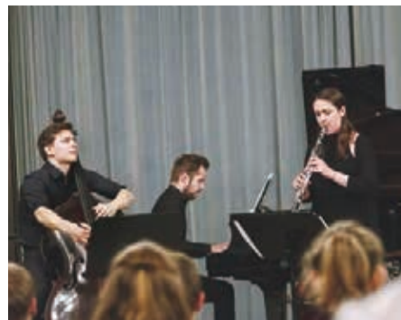
▲トリオ「カルナー・ワグナー」